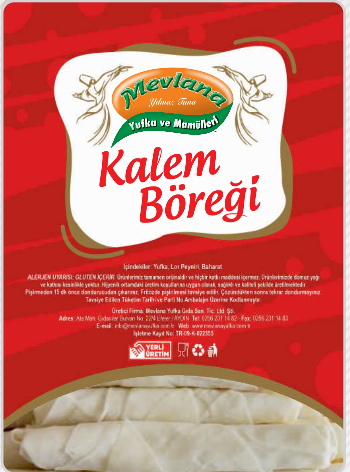
PEYNİRLİ KALEM BÖREĞİ

Peynirli Kalem Böreği Büyük Boy 24 g x 2,5 kg x 4 Koli: 10 kg