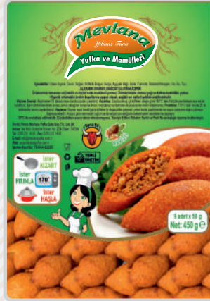
MİNİ İÇLİ KÖFTE Cevizli, Dana Kıymalı Premium Dana Kıymalı Lüks