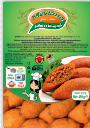
MİNİ İÇLİ KÖFTE Cevizli, Dana Kıymalı Premium Dana Kıymalı Lüks

Dana Kıyma, Soya Eko İçli Köfte 5 kg x 2 ad Koli: 10 kg 55-60g