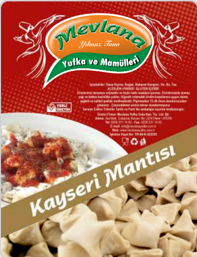
KAYSERİ MANTI (DANA KIYMALI)

Bohça Mantı - Soyalı 5 kg x 2 ad. Koli: 10 kg