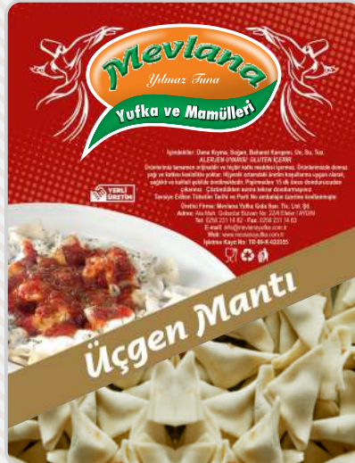
ÜÇGEN MANTI (DANA KIYMALI)