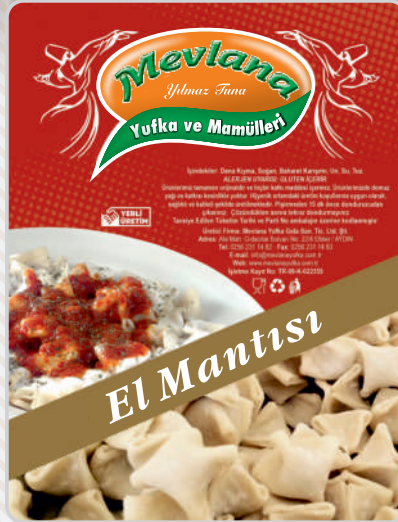
EL MANTISI (DANA KIYMALI)