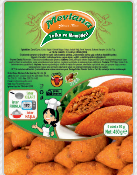
İÇLİ KÖFTE Dana Kıyma, Soya EKO