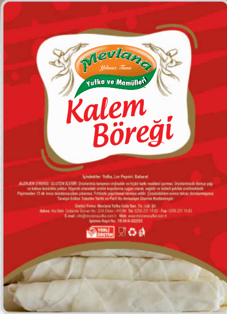
PEYNİRLİ KALEM BÖREĞİ