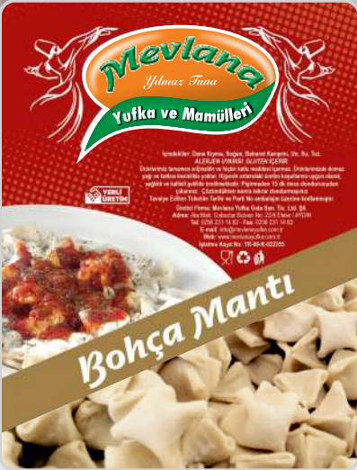
BOHÇA MANTI / DANA KIYMALI BOHÇA MANTI / SOYALI

BOHÇA / ÜÇGEN / KAYSERİ / EL MANTI DANA KIYMALI