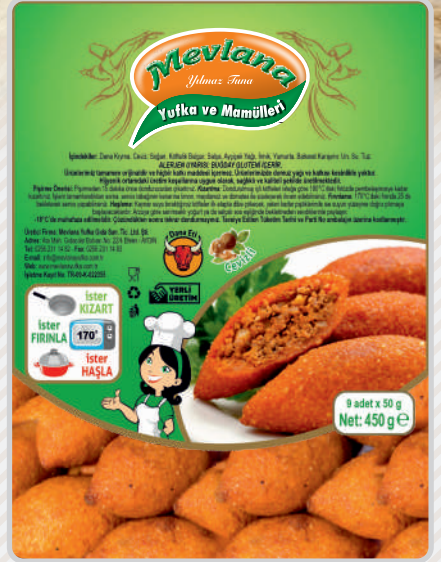
İÇLİ KÖFTE Dana Kıymalı Lüks